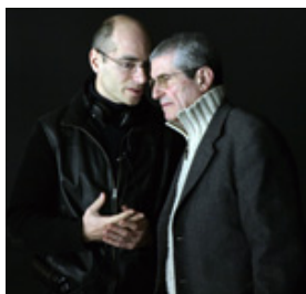
Bernard Werber & Claude Lelouch