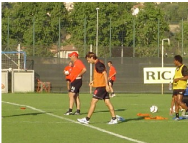
L'entraîneur prépare ses joueurs

Nouveau stade. « Tout le monde au club aurait préféré rester au Ray. C'est l'histoire du club. Il faut savoir se développer, faire grandir le club et pour cela, malgré nous, la construction d'un nouveau stade ailleurs qu'au Ray était obligatoire ».